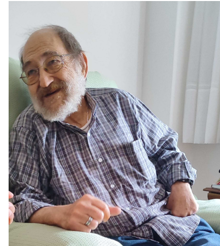
Palabras de Xesús no evanxeo de hoxe

porque a recompensa da vida é ser coherentes no camiño de facer crible o evanxeo facendo ben sen esperar nada a cambio.